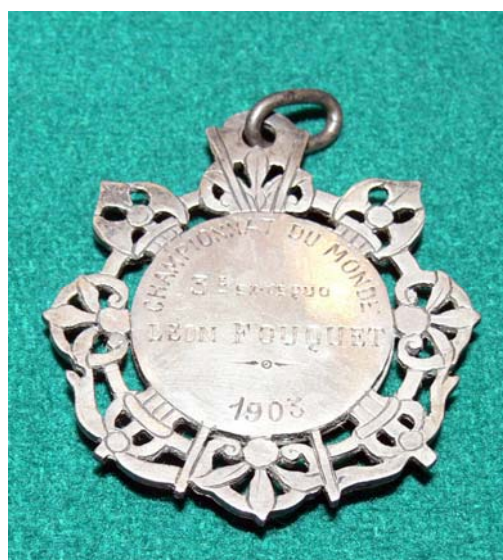
The medal of the third place - Leon Fouquet