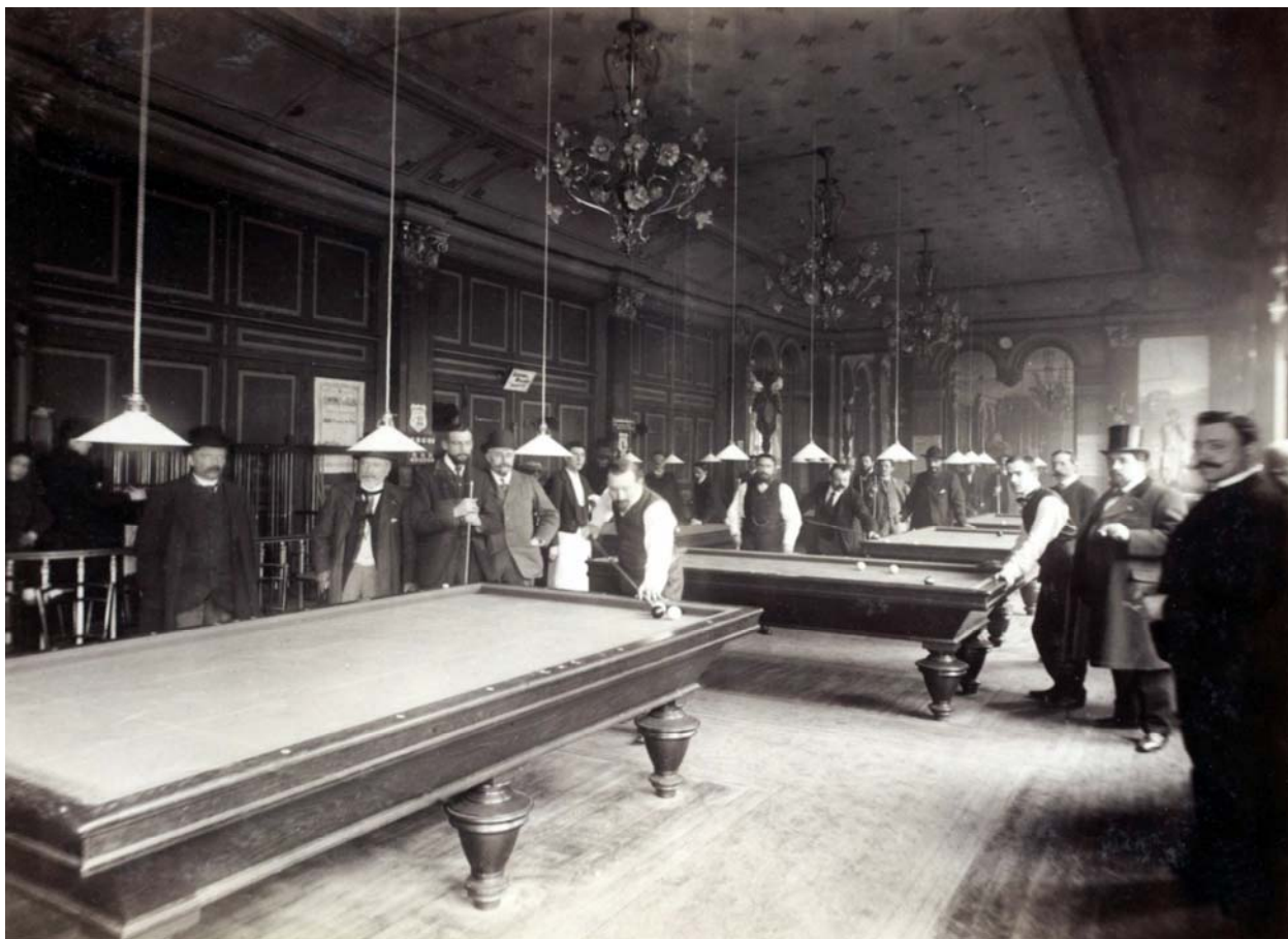
The tournament hall: Café l'Eldorado Paris